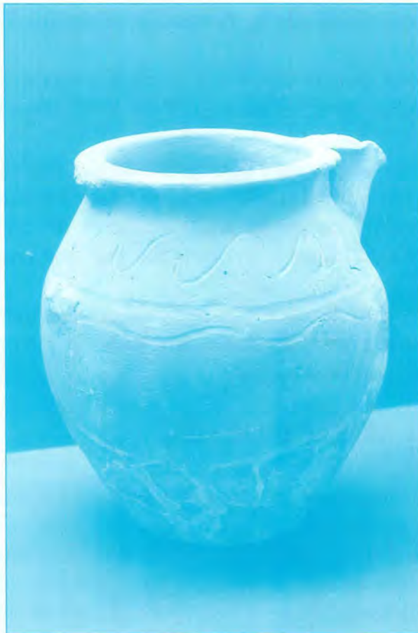
Pieza de Cerámica.

5.-¿Cual es la novedad del Yacimiento de Cerro de San Antonio ?.