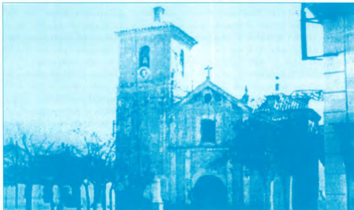
Antigua Iglesia de San Eugenio (Plaza Palacios-Getafe).

-Contaba también con Sacristía y 9 altares: (Altar Mayor, Altar de Sta. Lucía, de Sta. Bárbara, de Los Crispines, del Cristo de la Misericordia, de San Antonio, de Ntra. Sra. De las Virtudes, de Santiago y del Niño Jesús)